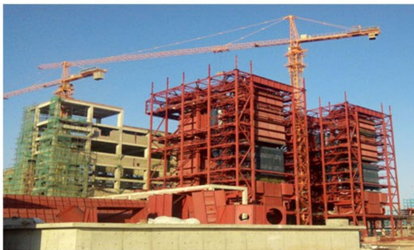
280t/h锅炉安装现场